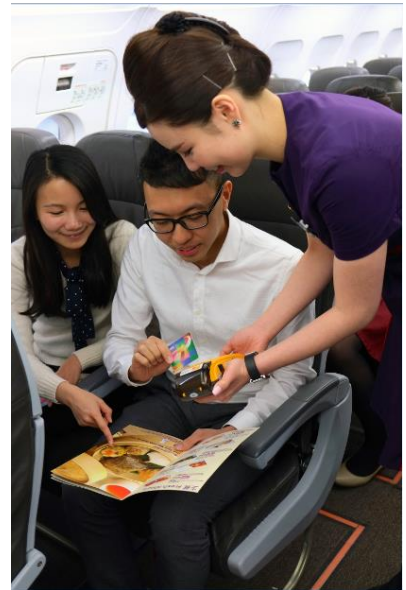
右图: 香港快运航空成为香港首家机上接受八达通支付服务的航空公司