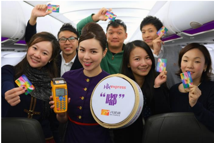
Left: Guests may use Octopus to purchase on-board items including in-flight menu choices, discounted transportation and attraction tickets, and special "sweet seats" upgrades.