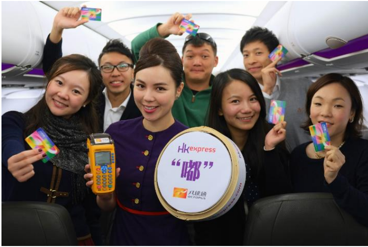
左图: 旅客可使用八达通购买香港快运航空机上销售的产品,包括餐饮、旅游车票和景点门票,以及「舒适空间座」的增值服务