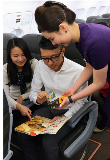
Right: HK Express becomes first Hong Kong carrier to offer on-board Octopus payment service.